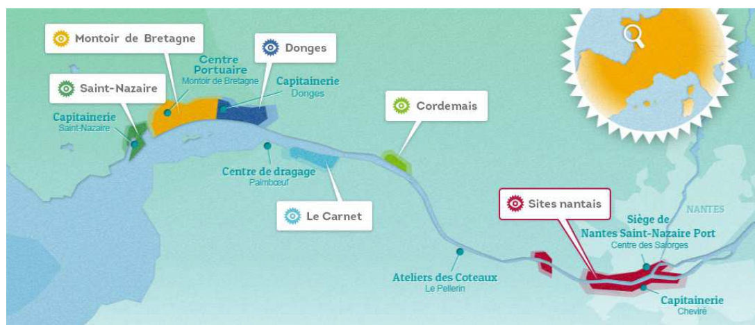
Figure 1: Cartographie schématique de la circonscription portuaire (extraite du dossier)

La circonscription portuaire couvre 28 387 hectares (ha), comprenant des secteurs terrestres, fluviaux et maritimes. 2 722 ha du domaine terrestre sont directement gérés par le GPM-NSN, parmi lesquels – suivant les différentes pièces du dossier – 1 350 ou 1 460 ha à vocation industrialo-portuaire (aménagés ou autorisés à l'aménagement), 1 077 ha à vocation naturelle, 125 ou 235 ha de réserve industrialo-portuaire, 60 ha d'espaces en zone urbaine (reconversion urbaine, rives, berge). S'y ajoutent 1 619 ha d'espaces estuariens transférés en gestion au Conservatoire du littoral en 2000.